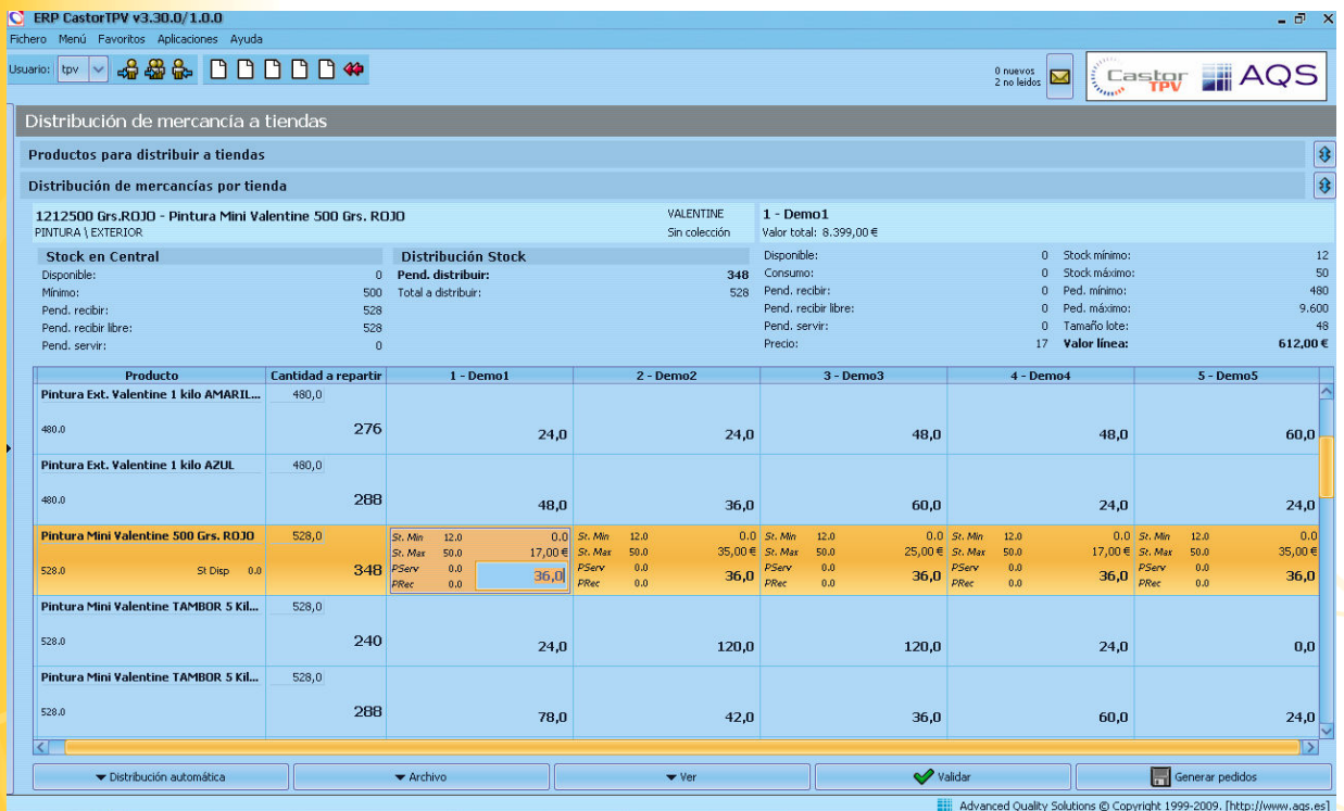
Parrilla de distribución producto x tienda.